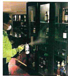
施工写真(ラウンジ) ※ガラスや鏡にも施工が可能