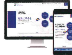
株式会社オプラス