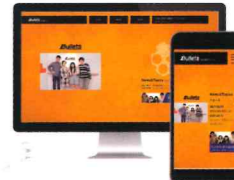
株式会社バレット