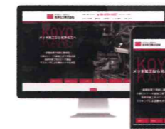
光洋化工株式会社