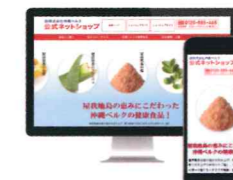
株式会社沖縄ベルク公式ネットショップ