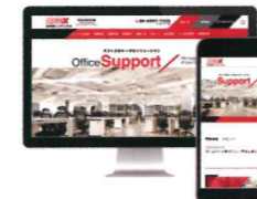
株式会社レダックス