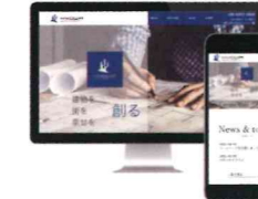
株式会社 KYOWA 都市デザイン