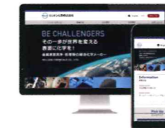
ミリオン化学株式会社