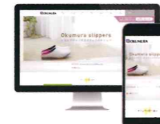
株式会社オクムラ