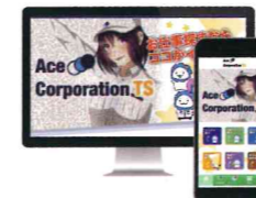
エースコーポレーションTS株式会社