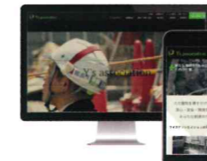
株式会社ワイズアソシエーション