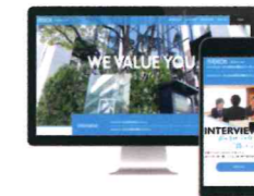
株式会社エイコー