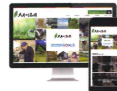
株式会社大井川茶園