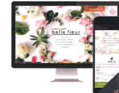
株式会社大伸シブレフ