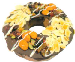
バレンタインバームA ¥1,400