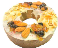
バレンタインバームB ¥1,400