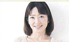
40代 女性 主婦 オイリー肌

敏感肌とは無関係だった超オイリー肌でしたが、「物は試し」ということでソープを使ってみました。初めは朝のみ洗顔し、なんとなくオイリー感が落ちついた気がしたので夜も洗顔してみると朝起きたときのベタつきも軽減され夕方方のオイリーさでとれたメイクも残る様になりました。クリームもオイリー肌が塗るとさらにオイリーになるとは思いましたが更に落ち着きました！