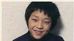
小学4年生 保護者様より

石けんを使った後かゆくならない。しっとりしているので息子が体をかくのが減ってきています。クリームもベタベタしすぎず、傷があってもかゆくならないみたいで気に入っています。夜に塗っておけば日中もしっとりするようで、体をかく回数が減って前のように傷まみれにならなくなりました。本当によかったです。ありがとうございます。