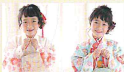
40代女性 お子様も家族全員

保湿力の持続時間が長いことに、とても自分に合っていると思いました。またコスバも良く、乾燥肌の私には(たっぷり使いたい)とてもリーズナブルだと思いました。全身に使えるし、毎日エアコン下だったり、マスクでも夕方までしっとりしています。子供の肌にも使えて、家族みんなで愛用しています。