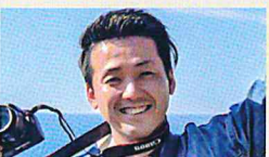
30代男性 乾燥肌・敏感肌

ソープの使用感はずっとピリつきがなく、つっぱらない。何より流す時に肌の手触りがツルツルして気持ちいい。化粧水はしっとり、少しとろっとした感じで保湿力が高く、ピリつきもなかったです。クリームも髭剃り後に使いたかったです。伸びが良く、朝から夜までしっとり感が続きました。継続して使うと荒れてくる商品が多かったのですが、こちらの商品は継続して使いたいです！