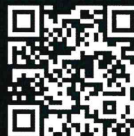
資料ダウンロード