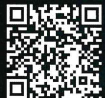
インタビュー動画